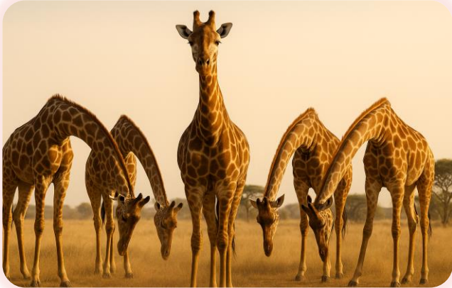
Жирафы опускают голову перед вожакom стада